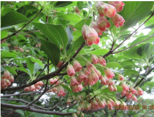
サラサドウダンツツジ