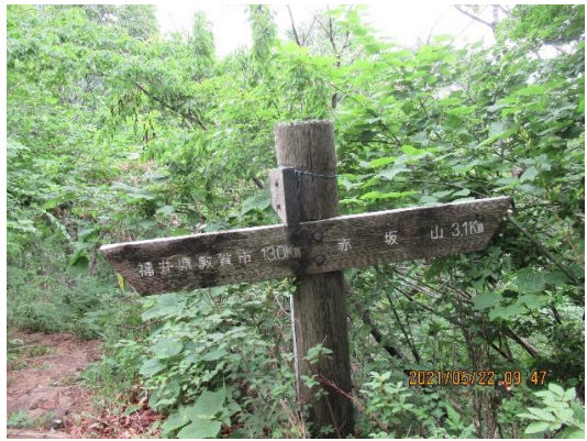
敦賀方面への分岐