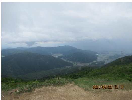
山頂から琵琶湖方面