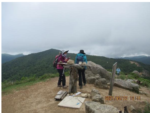
赤坂山山頂 後方の山は三国山