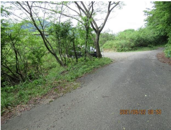
黒河林道脇に駐車