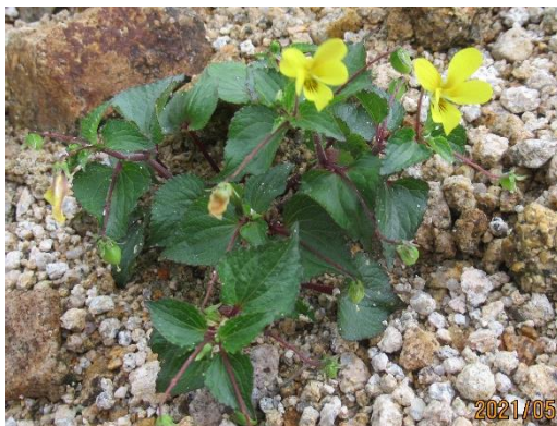
オオバノキスミレ