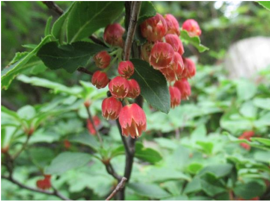
ベニドウダンツツジ