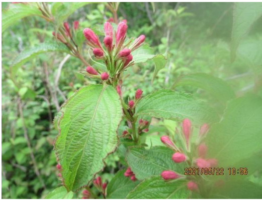
山頂で見つけたタニウツギの蕾