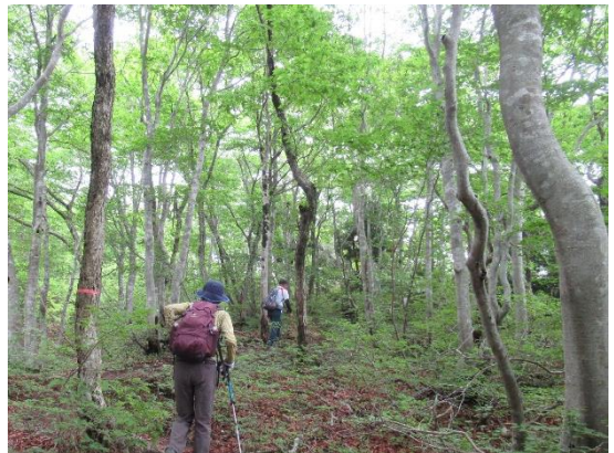
三国山へ ブナ林に行く