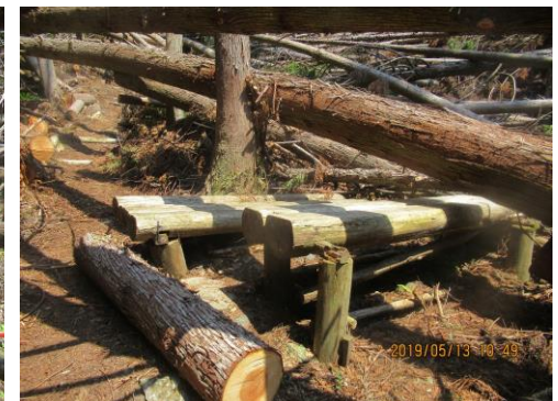
沢沿い入口のベンチ