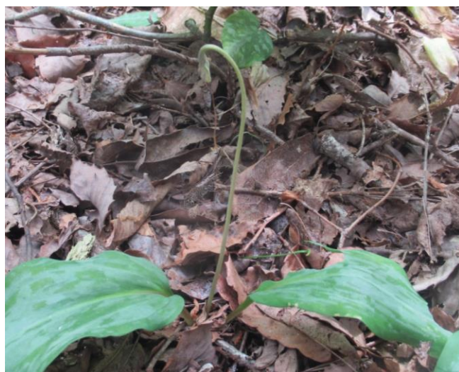
実をつけたカタクリの株と、花だけで終わってしまった株