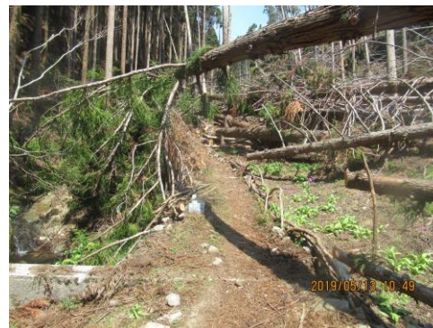
沢沿いに入るところ