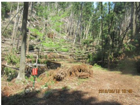
溪谷入口の橋付近

人が通れるように倒木が処理されていますが、切断された木はそのまま、20分くらいこのような所を歩きます。