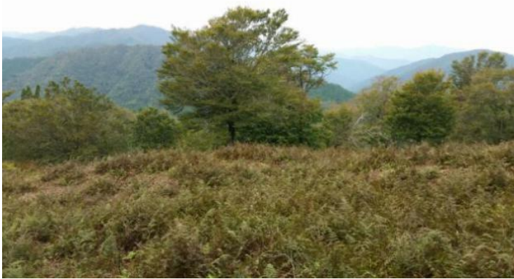
青葉山・若狭湾展望

11:40 広尾根を気持ち良く歩いていたら、遠くに青葉山や若狭湾が見える。いつの間にか違う方向に向かっていたので登り返す。