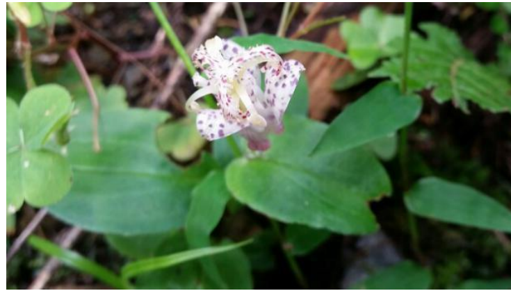
ヤマジノホトギス