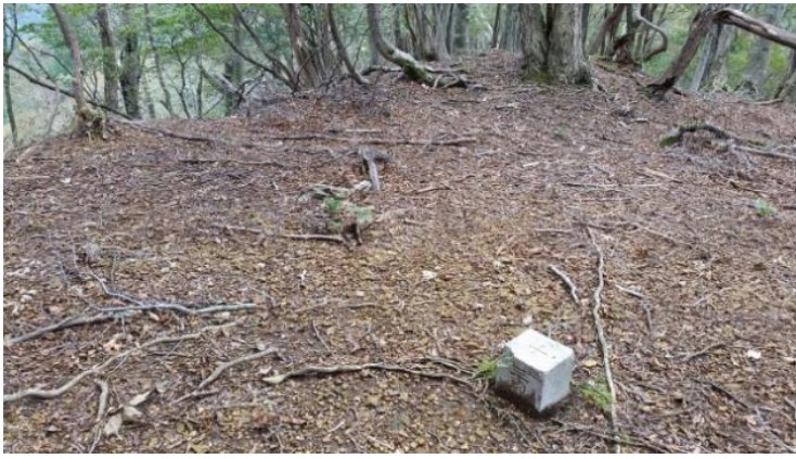
中山谷山 三等三角点

11:40 広尾根を気持ち良く歩いていたら、遠くに青葉山や若狭湾が見える。いつの間にか違う方向に向かっていたので登り返す。