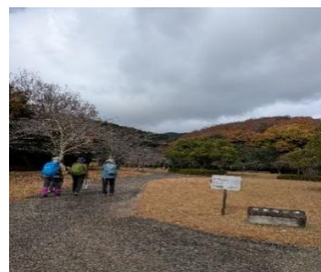
お疲れさまでした