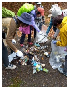
可燃ゴミ 3.5kg、 不燃ゴミ 2.5kg