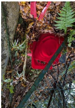
壊れたままではプラゴミ

山道にゴミはほとんど見られずこの活動を続けている意義を感じましたが、舗装道路沿いにはどちらのコースもいつも同じところに、いつも以上に多く捨てられているように感じました。