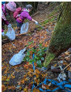
萩谷集落には生活ゴミ