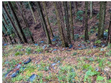
手に負えない数の不燃物